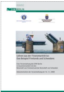
Lehren aus der Finanzmarktkrise: das Beispiel Finnlands und Schwedens; Dokumentation der Veranstaltung am 16.12.2008 in Berlin Berlin: DIW Berlin, 2009