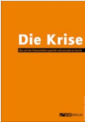
Die Krise: was auf den Finanzmärkten geschah und was jetzt zu tun ist Berlin: DIW Berlin, 2009

One-Off Publications We publish one-off publications dedicated to salient, current topics. These publications provide contributions to current debates and research topics and they contain hitherto unpublished articles relating to certain sets of issues.